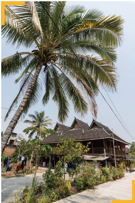
◎ 橄榄坝西双版纳傣族园

游客参与的“泼水节”热闹非凡。傣族人特有的彩色花伞极具艺术效果，采用低角度仰拍配合逆光效果，即可达到良好效果。拍摄泼水场面时，应采用高速快门（1/1000秒以上的快门速度），以凝固飞溅的水花及人们精彩的动作瞬间。