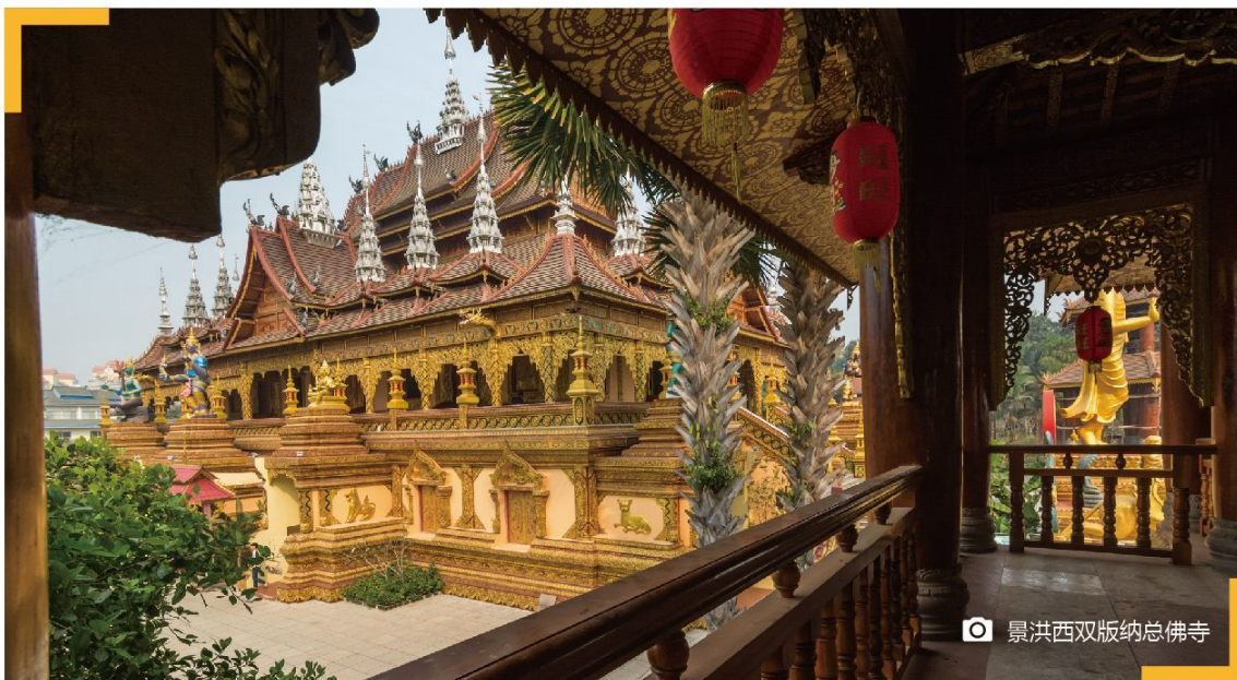
景洪西双版纳总佛寺

总佛寺 金碧辉煌，占地面积最大，游客最多。建议尽早达到，在游客大批涌入前，先拍摄全景。待人多时，可采用中长焦端拍摄局部特写。