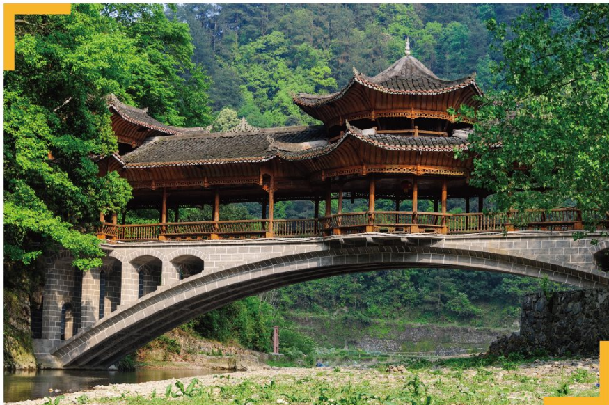
◎ 郎德上寨（苗寨）——三宝侗寨——岜沙村（苗寨）——小黄侗寨——肇兴侗寨